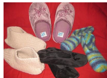
Michelles Helden der warmen Füße

Meine Hausschuhe liegen im ganzen Haus herum, weil ich sie erstens überall liegen lasse, und zweitens weil meine Hündin Kira sie klaut und in ihrem Körbchen oder sonst wo versteckt. Das Problem wird größer, weil ich immer mehr Hausschuhe geschenkt bekomme. Hausschuhe sind ja ein beliebtes Geschenk von Großeltern und Eltern.