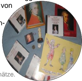
Dies sind meine Schätze.

Ich habe jetzt 4 CDs von Mozart. Ich höre sie andauernd, beim Zähneputzen, beim Baden u.s.w.. Meine Welt ist im Moment einfach eine Mozart-Kugel!!!