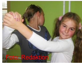
Wir in klassischer Tanzhaltung

Dort tanzen wir Rumba, Cha-Cha- Cha, Jive und langsamen Walzer. Das sind alles Paartänze, also tanzt man diese Tänze zu zweit. Wir haben einmal in der Woche Training. Es sind ein paar Mädchen und ein paar Jungen dabei. Oft kann ich die Tanzschritte schon, dann kommt die Musik dazu und plötzlich kann ich sie nicht mehr so gut. Musik und Tanz, das muss zusammen passen. Das ist nicht immer so leicht. Aber mir macht es viel Spaß, und es ist nie langweilig für mich.