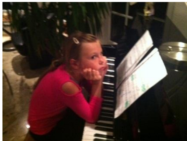
Hier macht es gerade keinen Spaß.

Wie lange muss man ein Lied vor einem Konzert üben? Das kommt echt auf das Lied an. Aber es kommt auch auf einen selbst an, z.B. wenn ich einen schlechten Tag habe oder ich einfach keine Lust habe, oder, oder, oder.