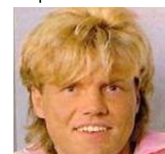
Dieter: so fit, so wow!

Modern Talking war ein deutsches Popmusik-Duo. Thomas Anders hat gesungen und Dieter Bohlen hat den Rest gemacht. Dieter Bohlen kennt ihr sicher aus der Sendung „Das Supertalent“. Dieter sieht auf dem CD-Cover so fit aus, wow! Und jetzt ja überhaupt nicht mehr.