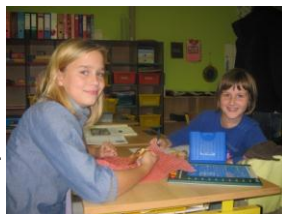
Zwei Gäste beim Tag der offenen Tür

Unsere Gäste können sich informieren und/ oder sich bei Kaffee und Kuchen unterhalten. Ganz offen und immer wieder gut – unser Tag der offenen Tür.