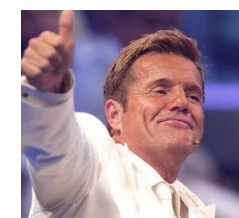
Dieter: nicht mehr wow!

Trotzdem ist der Titel „Cheri, Cheri Lady“ für mich sehr cool.