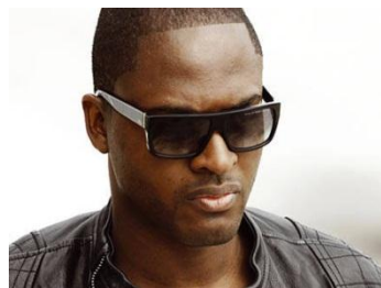
Taio Cruz mit „meiner“ Sonnenbrille

Zu unserem Topthema fällt mir nur eins ein: mein Lieblingsänger. Kennt ihr eigentlich Taio Cruz? Ich höre ihn auf meinem MP3-Player andauernd. Ich finde Taio Cruz sehr toll, weil er erstens so richtig mega singen kann und zweitens weil er soo tolle und klasse Songs schreibt und weil er drittens auch noch gut aussieht.