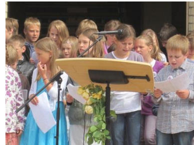
Hier singen wir.