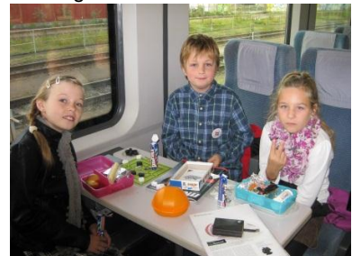
Wir auf der Fahrt nach Güstrow zur Preisverleihung.