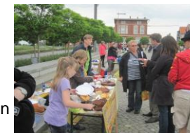
Wir beim Verkauf. Unser Kuchensortiment!