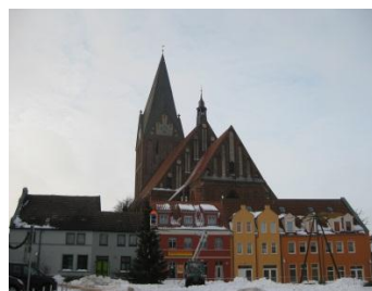
Unheimlich groß: Evangelische Kirche Sankt Marien